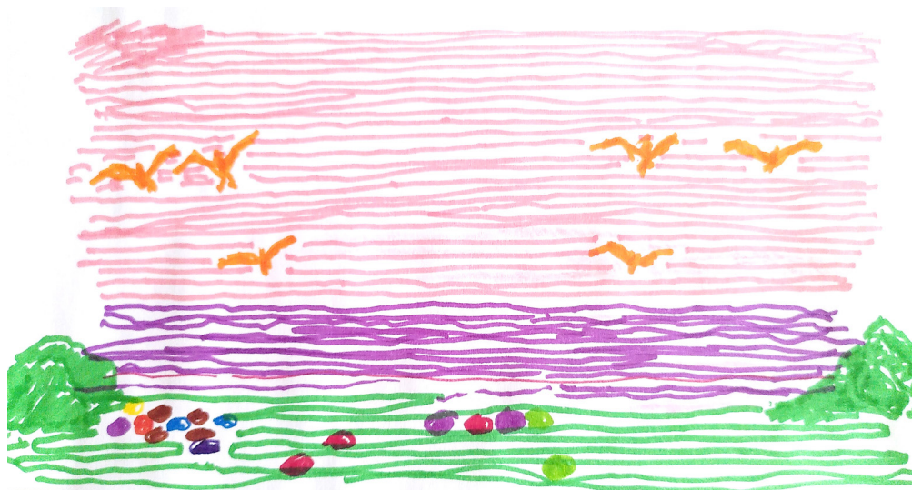
Dessin de Claire Chauvin